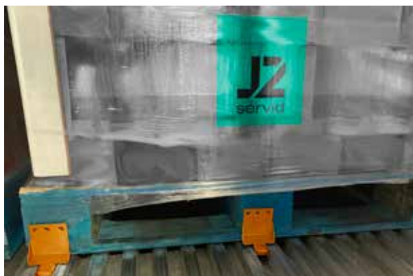
Colocación del fijador de palet en contenedor Reefer

Este producto está diseñado especialmente para suelos de madera. Está compuesto por tres dientes en los extremos, un extremo quedará fijado en el palet y el otro extremo en el suelo de madera. Este producto asegura una mejor sujeción de la mercancía.