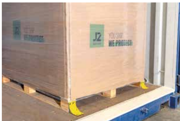
Colocación del fijador de palet

Estructura patentada para ofrecer la mejor resistencia y durabilidad.