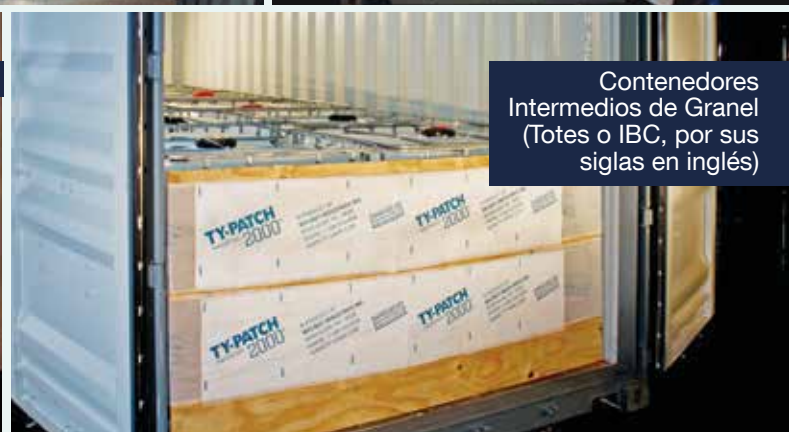
Contenedores Intermedios de Granel (Totes o IBC, por sus siglas en inglés)