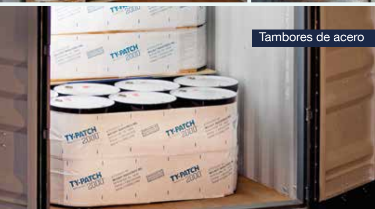
Tambores de acero