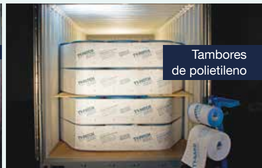
Tambores de polietileno