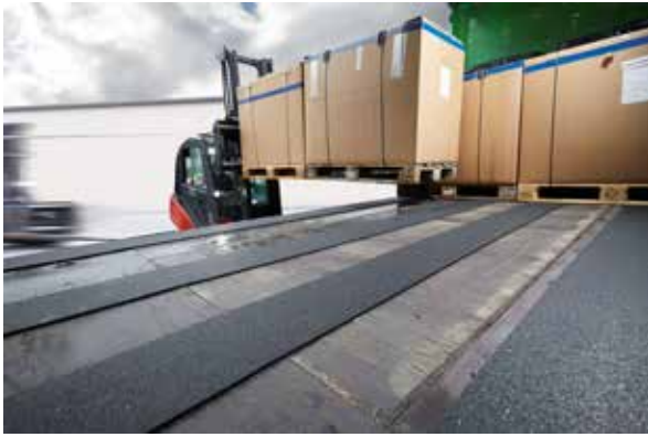
Colocación del antideslizante de goma