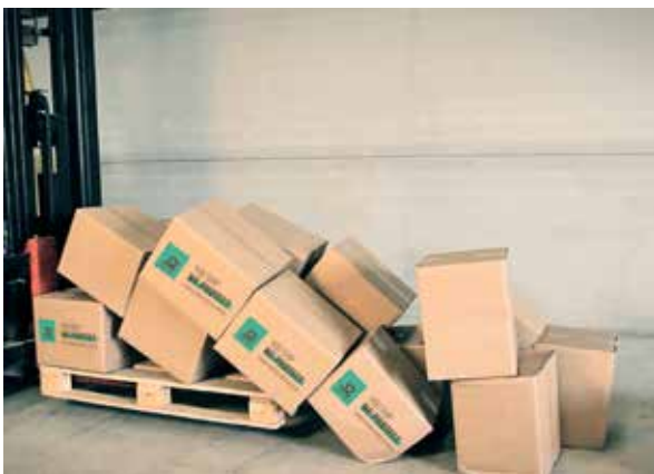
Ejemplo desperfectos sin antideslizante de papel