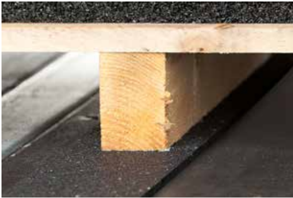
Colocación del palet encima del antideslizante de goma