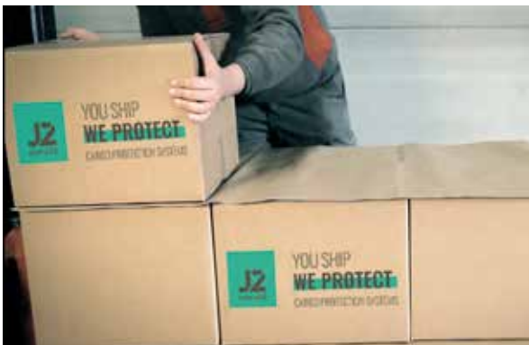
Colocación del intercalador antideslizante de papel